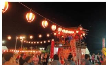
ならは百年祭 8月18日