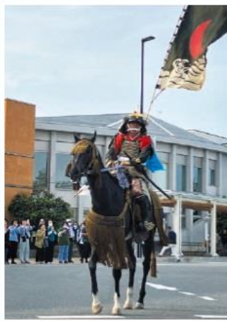
相馬野馬追2024 5月26日、双葉駅前前で撮影した 帰り馬です。