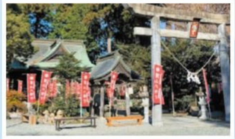
南相馬市鹿島区 男山八幡神社 子授け・安産・子育ての神様です。