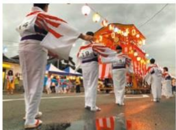
おだか夏まつり 8月17日

この地域に「戻ってきたい」「戻ってこられた」「通っている」方がいて、そこに「できることがないか」「やれることがある」と移り住まわれた方の想いが混ざりながらの催し物も、賑わいが徐々に大きくなっているように感じました。