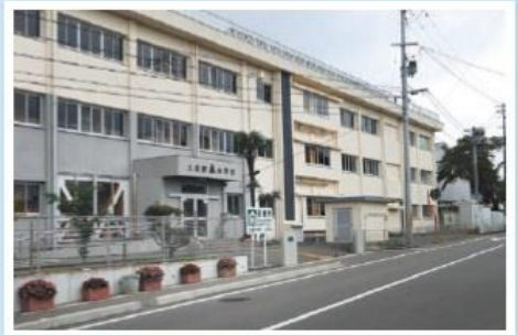
鹿島区上真野小学校

この地域に「戻ってきたい」「戻ってこられた」「通っている」方がいて、そこに「できることがないか」「やれることがある」と移り住まわれた方の想いが混ざりながらの催し物も、賑わいが徐々に大きくなっているように感じました。