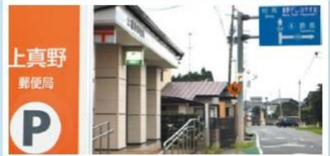
真野ダムへの標識(鹿島区真野郵便局前) 懐かしの“山麓線”を走ると見える風景です。