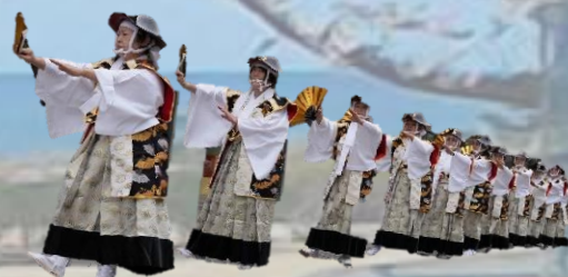
背景写真は天神岬スポーツ公園(楡葉町)