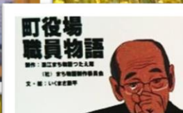
町役場 職員物語 もう一つの原発事故 町役場職員物語